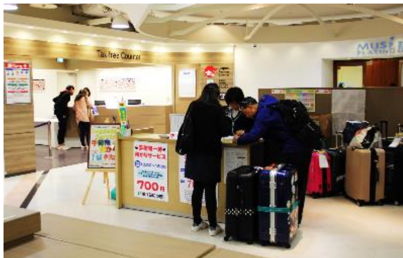
难波 CITY 地下 2 楼 宅急便柜台

位于难波 CITY 地下 2 楼免税柜台前的宅急便柜台仍将继续营业，欢迎各位游客使用。